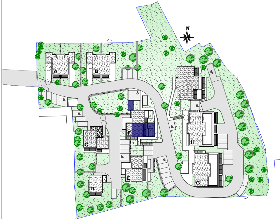
PLAN DE MASSE. Ech.1200e